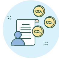
산림탄소 축적 증진 (REDD+, A/R, biochar)

Restoration of damaged ecosystem and enhancement of biodiversity (mangroves, drylands, wildfire affected area)