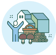
커뮤니티 비즈니스 (비목재 임산물, 생태관광 등)

Capacity development for MRV of forest carbon (satellite, drone)