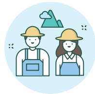
사회적 임업 (공동체 산림관리, 혼농임업 확대)

Community business (non-timber forest product, ecotourism)