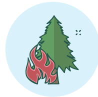
ICT 기반 산림 재해 완화

Expanding social forestry (e.g., community-based forest management, agroforestry)