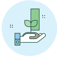
훼손된 생태계 복원 및 종다양성 증진 (맹그로브, 건조지, 산불 피해지 등)

Restoration of damaged ecosystem and enhancement of biodiversity (mangroves, drylands, wildfire affected area)