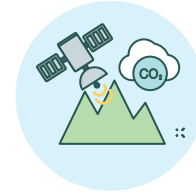
산림탄소 MRV 역량강화 (인공위성, 드론)

Forest carbon stock enhancement (REDD+, A/R, biochar)