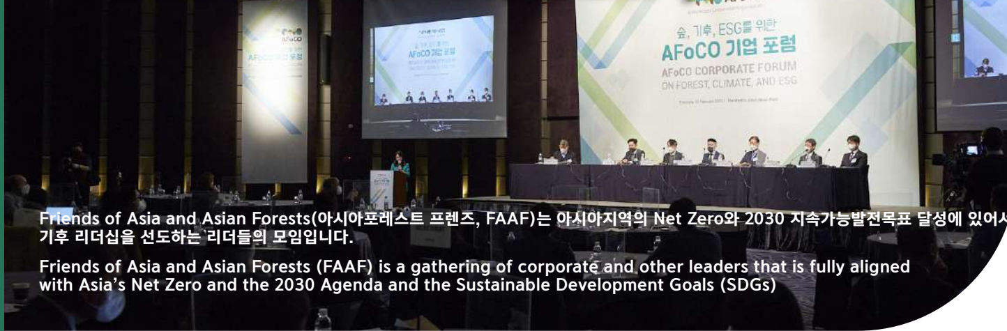
Friends of Asia and Asian Forests(아시아포레스트 프렌즈, FAAF)는 아시아지역의 Net Zero와 2030 지속가능발전목표 달성에 있어서 기후 리더십을 선도하는 리더들의 모임입니다.

Friends of Asia and Asian Forests (FAAF) is a gathering of corporate and other leaders that is fully aligned with Asia's Net Zero and the 2030 Agenda and the Sustainable Development Goals (SDGs)