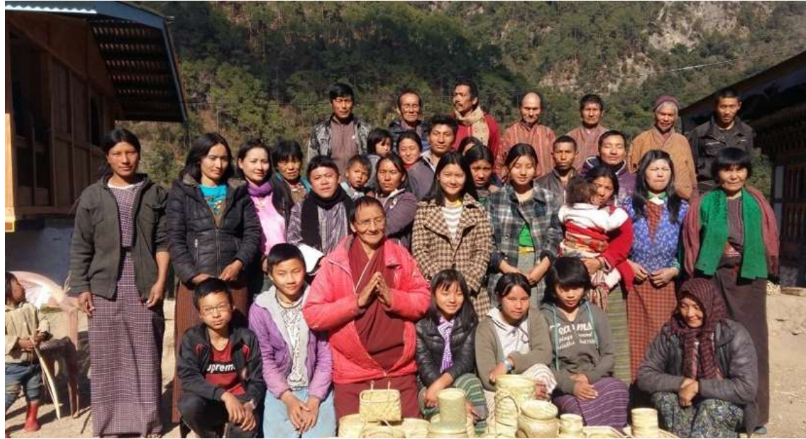
회원국내 대표적 비목재임산물 기업 모델 개발 및 역량 강화를 통한 산촌지역 생계 개선 Improving livelihoods in mountain communities through the development of representative non-timber forest products enterprise models and capacity building in member countries