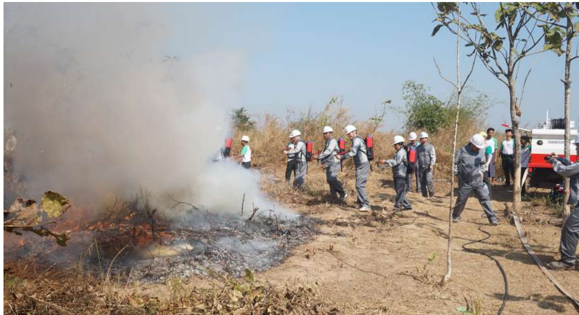
메콩지역 통합적 산불대응 시스템을 구축하여 산불관리 체계 개발 및 기후변화 적응력 강화 Developing a forest management system and strengthening climate change adaptation by establishing an integrated forest fire response system in the Mekong region