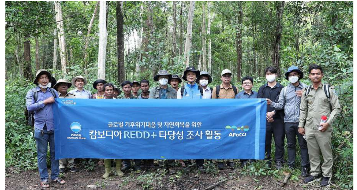
AFoCO는 우리은행과 함께 글로벌 기후위기 대응 및 자연회복을 위한 캄보디아 REDD+ 사업 협력 추진 Partnering with private entities to develop and participate in joint programs for forest restoration and biodiversity conservation, including Reducing Emissions from Deforestation and Forest Degradation (REDD+) initiatives